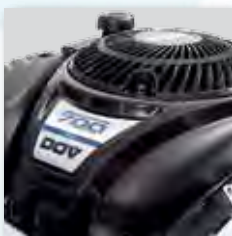
Motorisierung von Briggs & Stratton mit DOV Tech- nologie