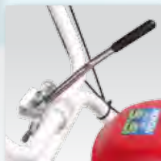
einfach zu bedienende Griffhöhenverstellung