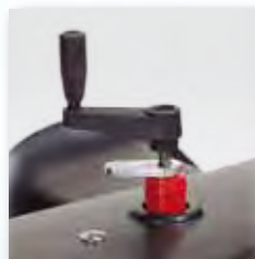
komfortable Einstellung des Stützrades über eine Kurbel