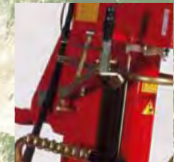
Zusätzliche Haltkralle für PS 18110Z