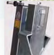
Spaltverlängerung PS 8110